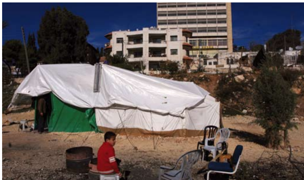
Det lave huset til høyre er huset til Im Kamel. Det er en israelsk militærpost rett bak, med minst to soldater hele døgnet. Det ligger ei gammel bosetting til høyre rett utafør bildet. De okkuperte noen hus, og så har de etter hvert bygd en del flere, også under jorda innunder palestinske hus.

å overta palestinerne hus, hager, jorder og områder.