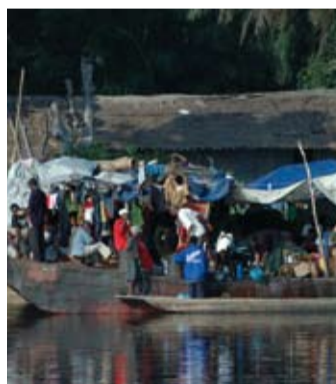
Ungenes lidelser i Kongo