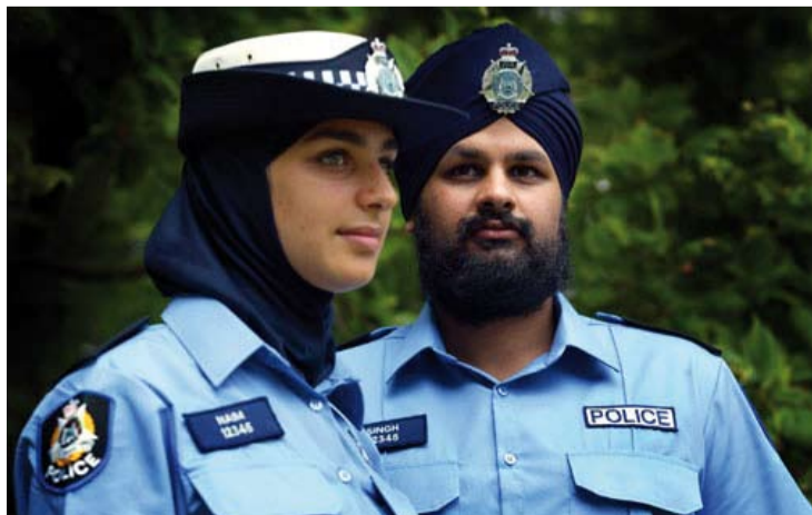
I Australia bærer politifolk hijab, turban og andre hodeplagg.