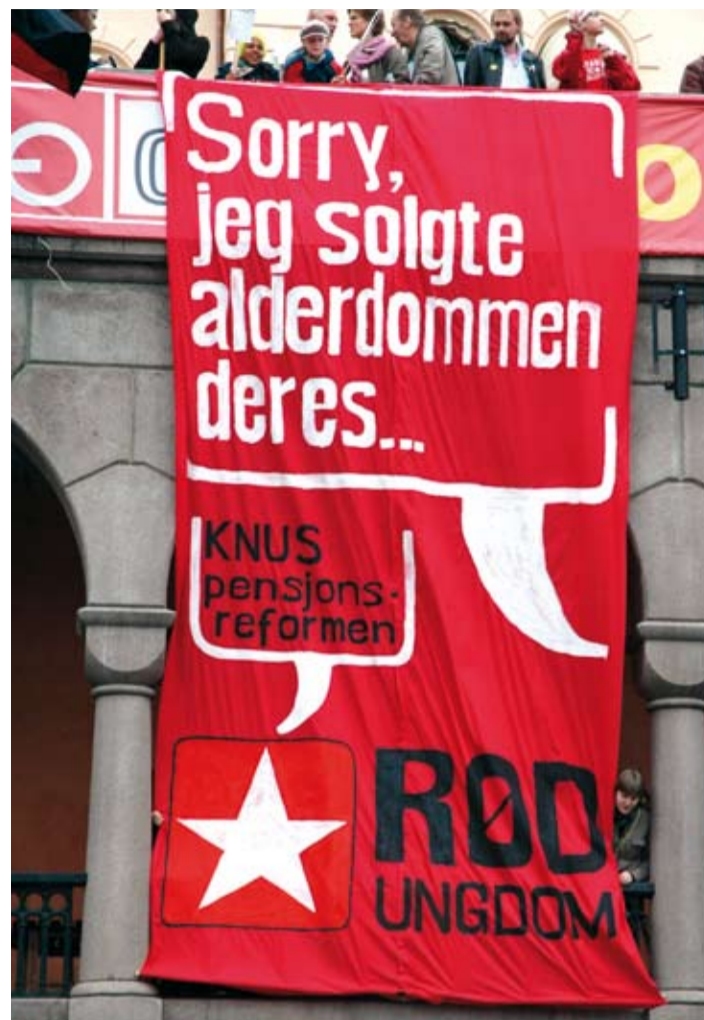
Fra Youngstorget 1. mai 2008.

Ta initiativ til at fagforeninga di har møte om mellomoppgjøret, der tjenestepensjonen blir diskutert. Foran og under tariffoppgjøret er det avgjørende å utvikle et press fra medlemmene overfor dem som forhandler.