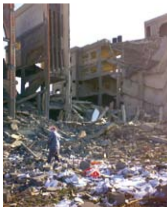
Overgrepa i Gaza