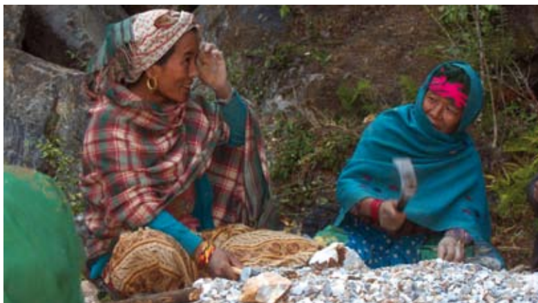
Kvinner lager vei i Nepal.

Helselaget fortsetter opplæring på sjukehuset. Bevilg penger til konto 6045 09 15745