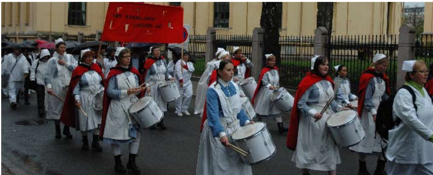
«Hev kvinnelønna! Likelønn nå!» Med illevarslende trommelyd gikk sjukepleierne i tog i Oslo 1. mai 2008.